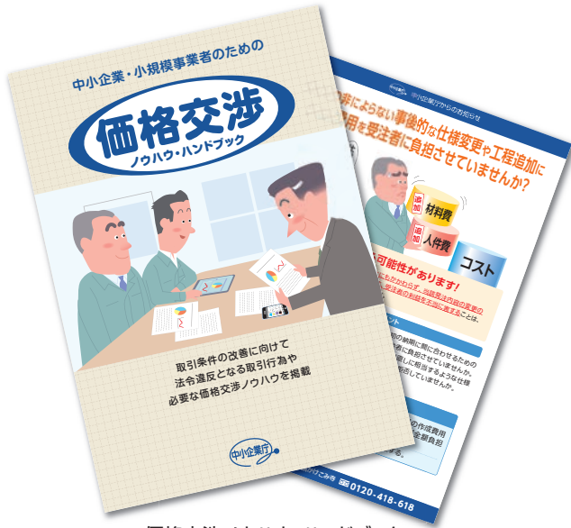
・価格交渉ノウハウ・ハンドブック ・事例集(10種類)

価格転嫁など取引条件の改善が進まず厳しい状況にある下請等中小企業の価格交渉力強化を支援するため、中小企業庁がハンドブック・事例集を作成しました。