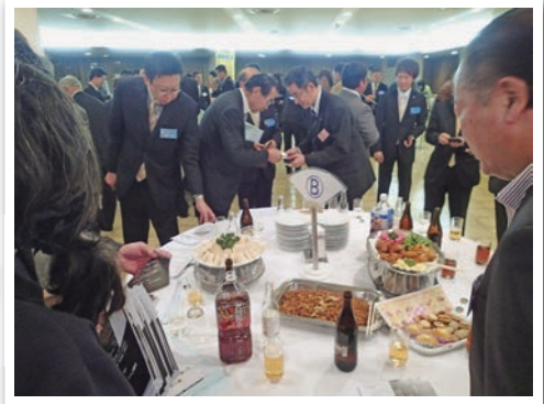
前回は400名超の参加