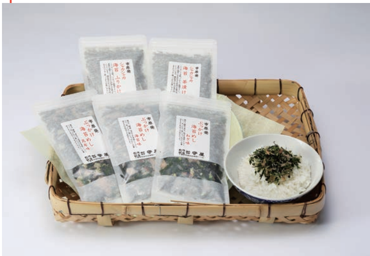
株式会社 守屋 「市原発」海苔ふりかけセット